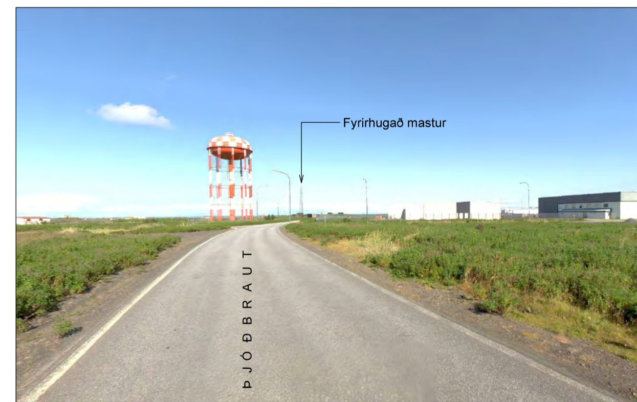
Í austurátt eftir Þjóðbraut