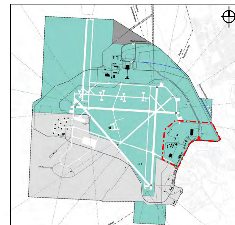
HLUTI AF AÐALSKIPULAGI KEFLAVÍKURFLUGVALLAR (2013-2030) Ekki í mælikvarða