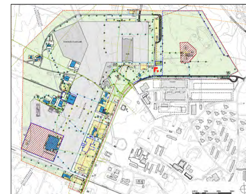
AUSTURSVÆÐI / HÁALEITISHLAÐ Keflavíkurflugvöllur Ekki í mælikvarða Gildandi deiliskipulag

Deiliskipulagsbreyting þessi, sem hefur fengið