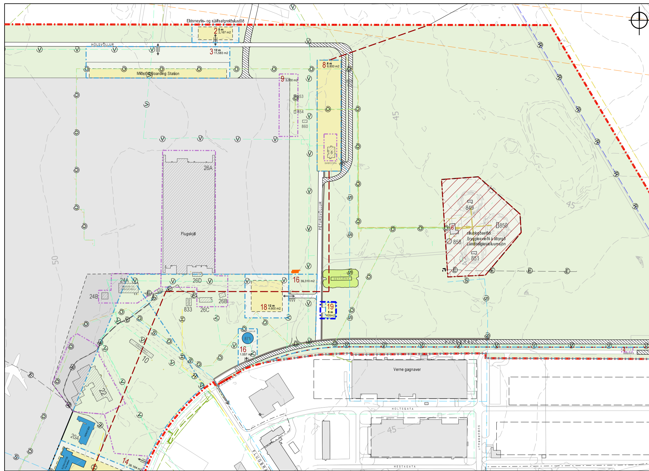
TILLAGA AÐ BREYTINGU Á DEILSKIPULAGI