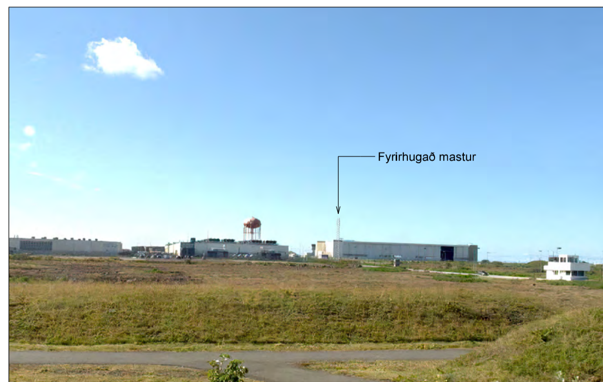
Í norðurátt frá Valhallarbraut