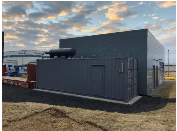
Ný varaafstöð að Flákavöllum 11

Margir tóku þátt og þurfti að fara í ýmsar prófanir áður en hægt var að taka netspennu af flugstöðinni. Fulltrúar frá Johann Rönnung, Grjótgörðum, Lagnþjónustunni, Rafholti, HS Veitum, Orkuvirki, Rafholti, Kletti, Mannviti og Verkís komu að þessu verkefni og þökkum við þeim kærlega fyrir sitt framlag. Unnið verður að fínstillingum og frágangi í janúarmánuði en að öðru leyti er verkefninu lokið og ætti þessi uppsetning varaafls að anna því aukna álagi sem fylgt hefur stækkun flugstöðvarinnar í bili.