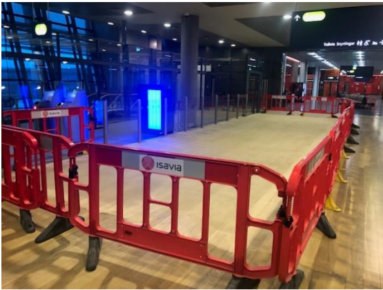
Lagfæringar á parketi – svæði vel afgirt