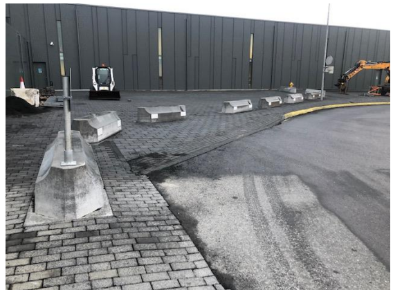
Öryggistálmar komnir vestanmegin

Verið er að lagfæra parket í suðurbyggingu þar sem unnið verður í litlum þörtum næstu mánuði. Eins og sjá má á er framkvæmdarsvæði vel afgirt og reynt er að takmarka áhrif á rekstur.