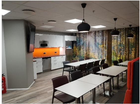
Aðstaða starfsmanna í farþegaþjónustu

Framkvæmdir vegna breytinga á aðstöðu starfsmanna í farþegaþjónustu í kjallara norðurbyggingar lauk í lok desember. Helstu breytingar eru meðal annars að útbúin hefur verið ný og opin kaffistofa, setuhorn, stúkað hvíldarrými og rými fyrir munaskápa og fatnað.