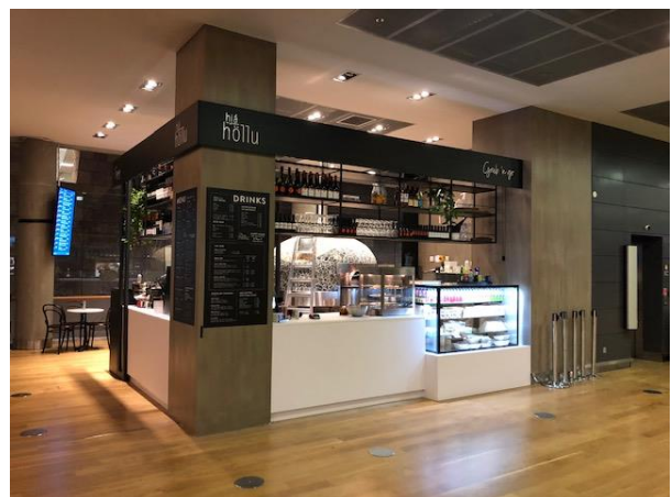
Hjá Höllu - Suðurbygging

Framkvæmdir við nýjan veitingastað, „Hjá Höllu“, er lokið og opnaði veitingarstaðurinn formlega 9. október. Staðurinn er í suðurbyggingu flugvallarins þar sem stutt er í öll brottfararhlið og því tilvalið að setjast þar niður áður en farið er í flug. Hjá Höllu er boðið upp á hollan og góðan mat sem er unninn frá grunni úr hágæðahráefnum. Eldofn er á staðnum þar sem boðið er upp á eldbakaðar pizzur sem tekur örstuttan tíma að útbúa. Happy hour er alla daga frá kl. 13 til 15.