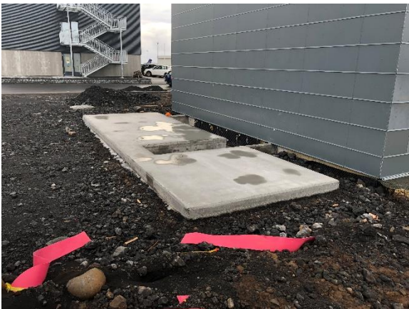
Undirstaða nýrrar rafstöðvar

Undirbúningur fyrir nýja rafstöð er í fullum gangi en ný rafstöð fyrir flugstöðina verður komið fyrir í gámaeiningu frá AtlasCopco austanmegin við núverandi dísilstöð sem staðsett er við Fálkavöll 11. Undirstaða hefur verið steipt og er áætlað er að rafstöðin komi til landsins innan þriggja vikna. Undirbúningur fyrir tengingar og uppsetningu gengur vel og mun nýja rafstöðin keyra samhliða núverandi rafstöð í neyðartilvikum. Þörfin á nýrri rafstöð er vegna aukinnar raforkunotkunar í flugstöðvarbyggingunni sem tengist stækkunum síðastliðinna ára.