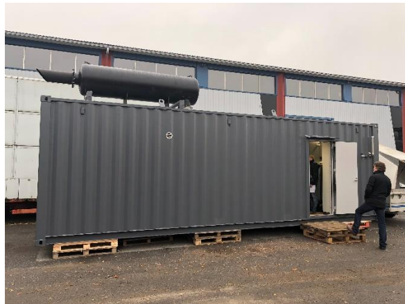
Gámaeining sem mun hýsa nýju rafstöðina