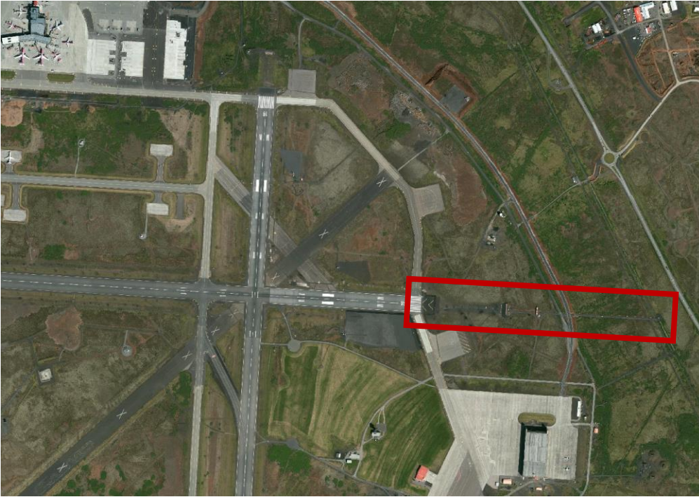
Staðsetning nýrra aðflugsljósa við flugbraut 28

Kveikt hefur verið á nýjum aðflugsljósum fyrir flugbraut 28 og munu þau vera virk frá og með 9. nóvember.